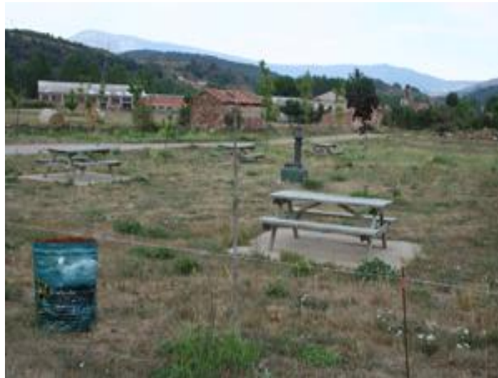
Área de descanso en Quintanaluengos.