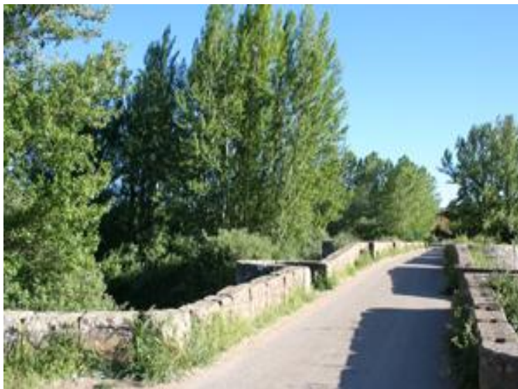
Puente medieval de Salinas.

El tráfico de vehículos pesados y la lluvia han deteriorado la plataforma del camino en su primera parte. Como consecuencia de ello la circulación se hace molesta en un tramo en el que, un tiempo atrás, circular era un placer. Cuando estas dificultades lo permitan, disfruta de los escenarios del río sus corrientes y zonas remansadas.