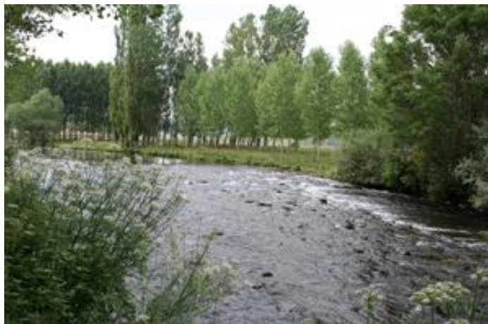
Curso del río en las proximidades de Liguérezana.

Irrenunciable intercalar algunas paradas en las que poder gozar del curso del río, sus corrientes o sus zonas remansadas.