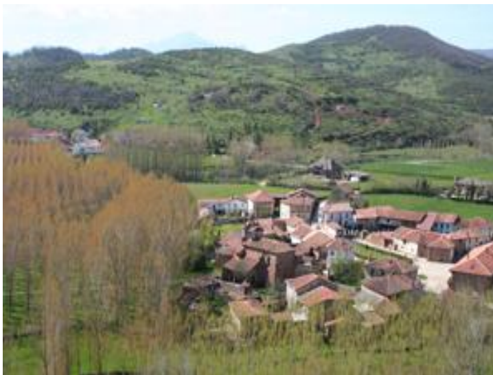
Picado sobre Rueda..

El telón de fondo es impresionante. 180 grados de montañas. A la izquierda: Espiñete, Pico Murcia y el sin par Curavacas. En la mano opuesta las Sierras de Peñalabra e Hajar, con las cumbres de Peñalabra, Tres Mares, Cuchillón, Cueto Mañín y Valdecebollas.