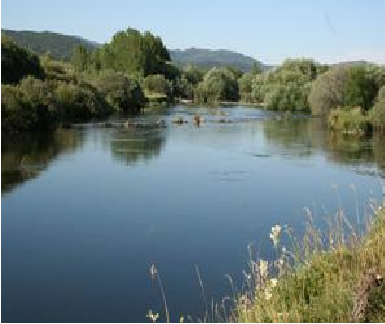
Remanso en el Pisuerga.