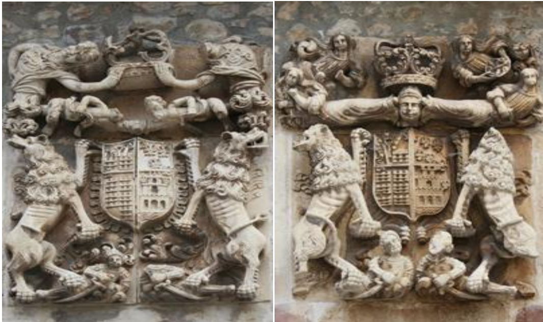
Blasones nobiliarios primorosamente labrados. Se encuentran en la llamada Casa de los Leones de Cervera.

Km. 12,250 Seguir en línea recta hasta el ayuntamiento de Cervera de Pisuerga. Termina el viaje de ida. Quien lo desee puede realizar una primera toma de contacto con esta Muy Noble, Muy Leal e Ilustrísima Villa que en sus orígenes se denominó Cervaria .