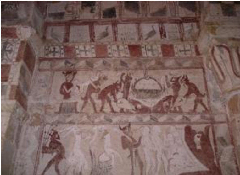
Murales en el interior de Santa Eulalia

La ermita es Monumento Histórico-Artístico. Uno de los ejemplares más perfectos y elegantes del románico palentino, s. XII. A destacar sus valiosos capiteles de primorosa talla.