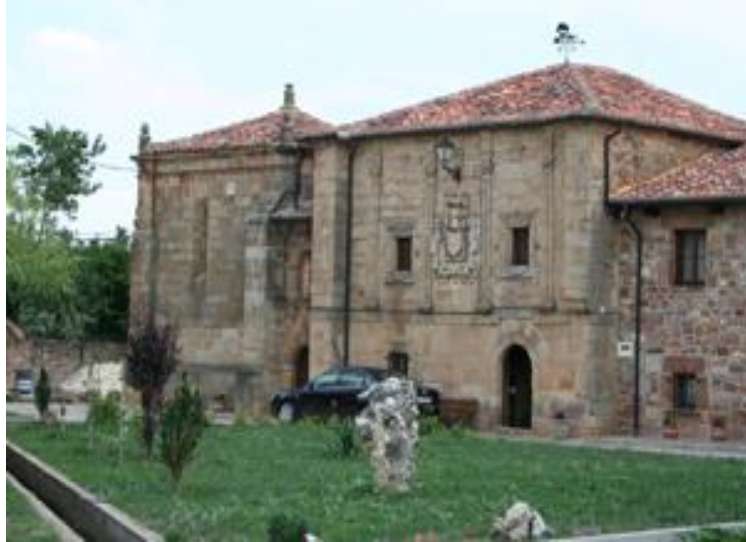
Casa-palacio de los Velasco. Soberbia referencia.

Pasando junto a esta casa de los Velasco nos incorporamos, de nuevo, al camino de tierra.