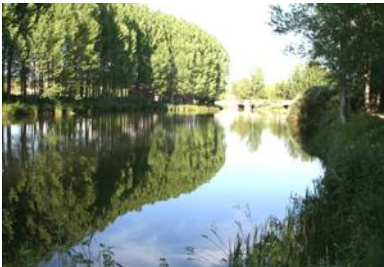
Chopera de Salinas en la ribera del Pisuerga. Espejo de agua.

Km. 0,000 Salinas de Pisuerga. Plaza del Ayuntamiento. Descender unos metros y cruzar la antigua carretera Aguilar-Cervera, para dirigirse hacia el puente medieval.