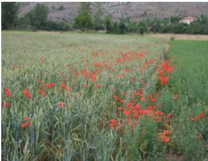
Campo y amapolas.

A buen seguro que va a agradecer el consejo.