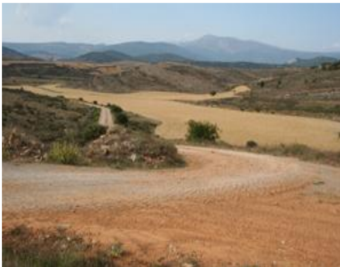
En descenso hacia Barcenilla. Como telón de fondo aparece Valdecebollas

Km. 19,600 Otra vez en camino de tierra compactada. Paso bajo el puente metálico por el que circula el ferrocarril Bilbao-León. Se recupera el acompañamiento del Pisuerga, a mano izquierda. Así hasta Salinas.