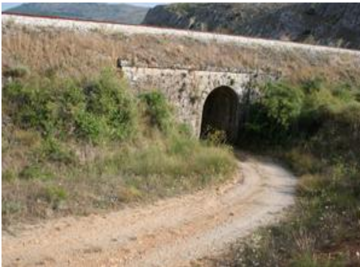
El camino penetra en el túnel bajo el ferrocarril.

Km. 5,000 Cruce de caminos. Tomar el de la izquierda.