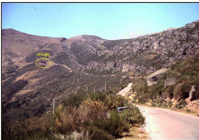
Último tramo de la dura ascensión. Es la zona más asequible, pero no hay que relajarse.

Para superar una de estas pruebas es necesario tener una notable capacidad de sufrimiento, con la que soportar y superar las dificultades que van a presentarse. Hay que seguir adelante a pesar de los momentos de decaimiento y de zozobra. La satisfacción que la conquista de uno de estos monstruos produce en el atleta, es puro placer de dioses, reservado a unos pocos. Será el único y merecido premio que va a encontrar en esa cima que parece estar siempre al doblar esa última curva, situación que se repite de manera sistemática, como espejismo inalcanzable.