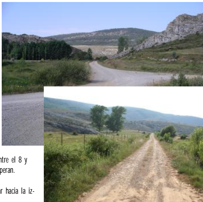
Superado el paso entre los roquedos, se iniciará la ascensión a la ladera del Caderamo.

Km. 6,080 Cumbre con nueva desviación. A la izquierda.