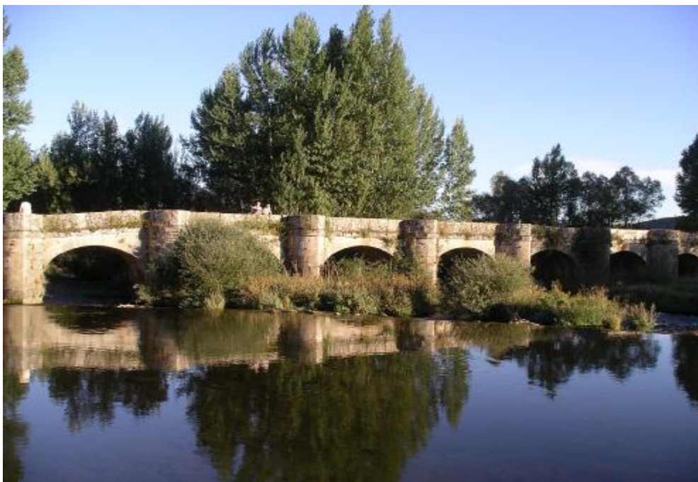
SALINAS DE PISUERGA.- Se abandona la localidad cruzando sobre su bello puente medieval que une las orillas del Pisuerga.

Km. 0,400 Inmediatamente cruzado, tomar el camino de tierra compactada, a mano derecha que, en paralelo al río Pisuerga, va festoneando su orilla.