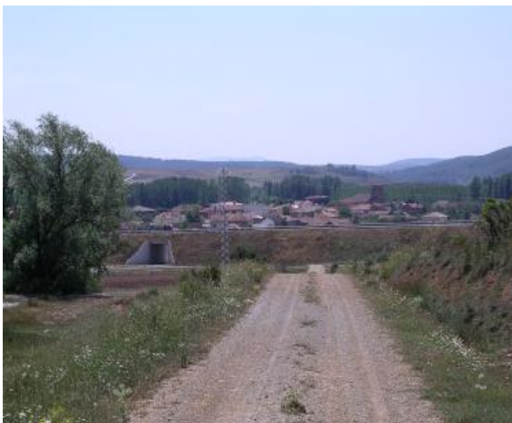
Pasando bajo el túnel de la carretera de circunvalación hemos dejado atrás Salinas.

Km. 0,000 Salinas de Pisuerga. Plaza del Ayuntamiento. Siguiendo la acera del edificio consistorial, salir en sentido ascendente hasta alcanzar la calle Mayor y aquí girar a mano izquierda. Continuar en línea recta hasta el final del pueblo.