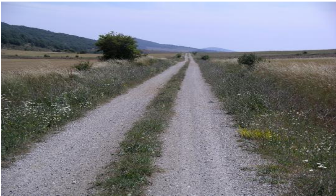
Camino de regreso a Salinas.

Km. 14,400 Salinas de Pisuerga. Plaza del Ayuntamiento. Gracias por tu atención.